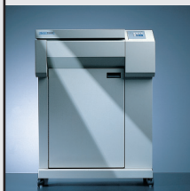
T 6050 500 lpm