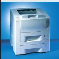
T 9216 16 ppm