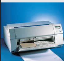
T 2265 900 cps