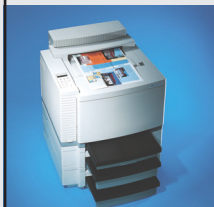
T 8406 color 6 / 24 ppm - A4