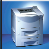
T 9120 20 ppm