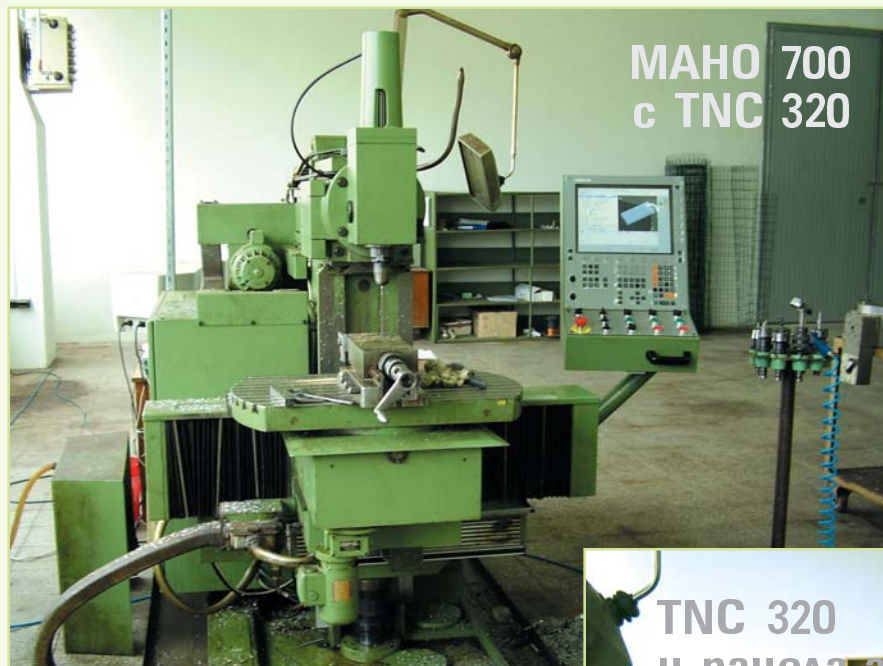
МАНО 700 с TNC 320