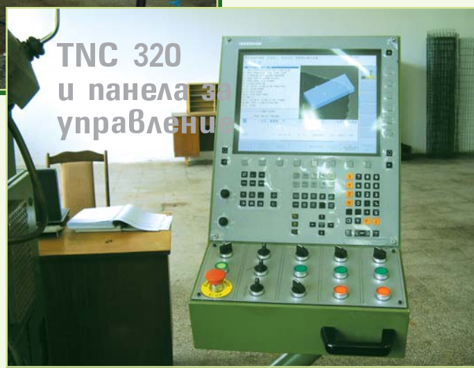
TNC 320 и панела за управление