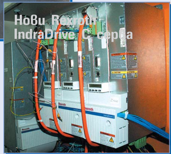
Нови Rexroth IndraDrive C серва