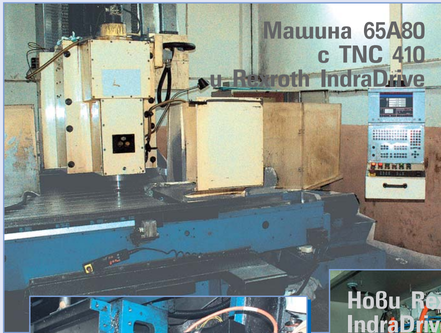
Машина 65A80 с TNC 410 и Rexroth IndraDrive